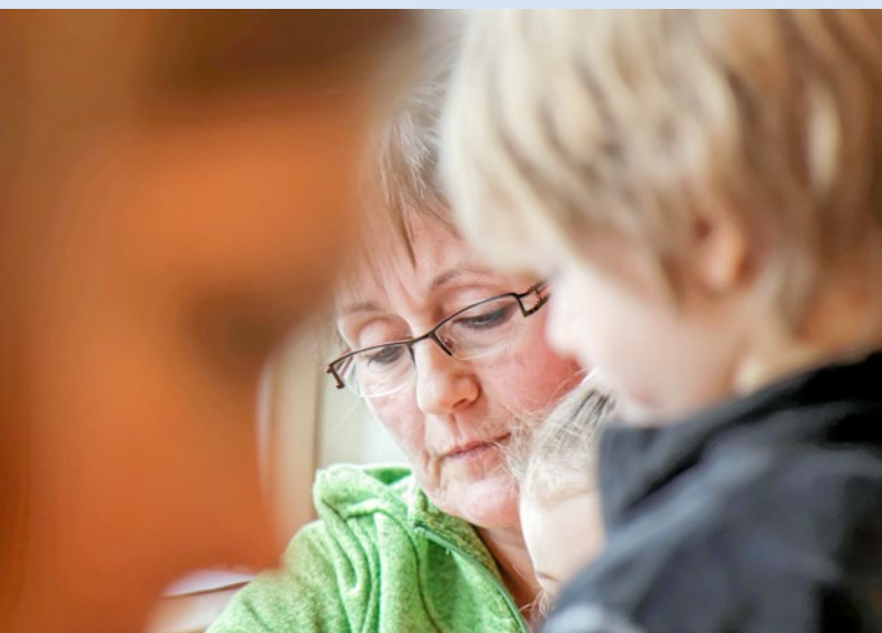
Joachim E. Roetters GRAFFITI

Zu Recht steigen die Anforderungen an eine qualitativ hochwertige frühkindliche Bildung. Zugleich nehmen die gesellschaftlichen Probleme und damit die Herausforderungen in den Einrichtungen zu. Zentrale Voraussetzung für die Erfüllung der Ansprüche sind fachgerechte Fachkraft-Kind-Schlüssel. Deren Einführung auch für den Kindergartenbereich haben sowohl diese Landesregierung als auch ihre Vorgängerin versprochen. Soll dieses Versprechen an Eltern, Kinder und Beschäftigte nun erneut gebrochen werden?